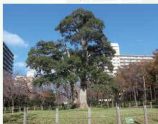
⑨ 君津のイシモチ(クロガネモチ) 千葉県君津市の生まれで、庄屋の庭で200年を掛け大木に成長、昭和50年代に東京に嫁入りました。大島小松川公園のシンボル樹です。