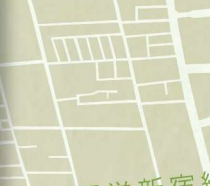
④ 小松川千本桜 約1000本を超える桜の名所、桜のトンネルをお楽しみください。見ごろは3月下旬～