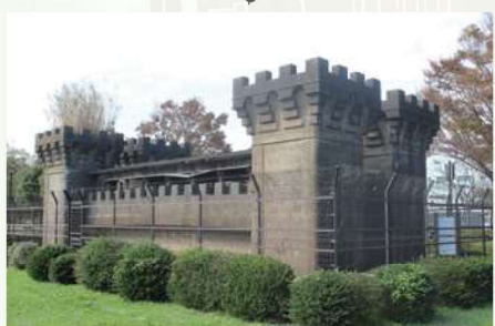
① 旧小松川閘門 荒川放水路開削により旧中川との水位差解消のため、昭和5年に完成した小松川閘門は、昭和50年代に廃止されました。中世の城館のような旧閘門は旧中川側の1基が残され2/3は地中です。東京都選定歴史的建造物です。