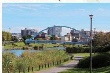
ふれあい橋がつなぐ 旧中川両岸のアジサイ (5月中旬～6月中旬)