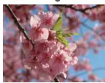
⑤ 旧中川の河津桜 見ごろは3月上旬～