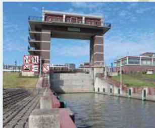
② 荒川ロックゲート

荒川と中川の水位差解消のため、小松川閘門と同形の閘門が作られました。頭頂部が荒川治水資料館に現存しています。