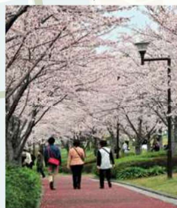
④ 小松川千本桜 約1000本を超える桜の名所、桜のトンネルをお楽しみください。見ごろは3月下旬～