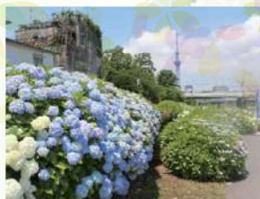
⑦ 江東区側のアジサイ 平成24年から植栽、色々なアジサイを楽しむことができます。見ごろは5月中旬～