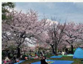
⑧ 大島小松川公園 ソメイヨシノをはじめ様々な品種の桜が植えられているお花見公園。