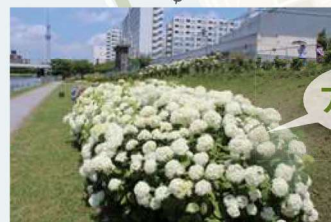
⑥ 江戸川区側のアジサイ 穴場のフォトスポットにもなっています。平成30年から植栽、6種類のアジサイを楽しむことができます。見ごろは5月中旬～