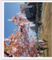
河津桜 見頃/2月中旬~下旬