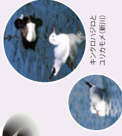
ユリカモメ(旧中川) ユリカモメ(新川) キンクロハジロとユリカモメ(新川)