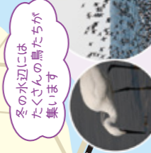
コサギ (新左卫门湧水公園) スズガモ (葛西海浜公園)