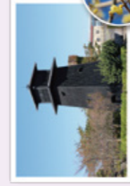
西水門広場(火の見やぐら)