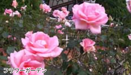
フラワーガーデン