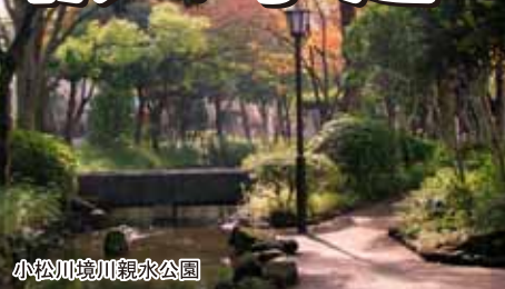
小松川境川親水公園