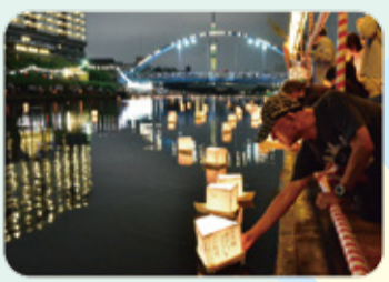
11 第19回 旧中川灯籠流し

期間中の土日 直通バス運行 JR小岩駅~小岩菖蒲園 ※6月3日(土)・4日(日) 足立区しょうぶ沼公園との無料シャトルバス運行