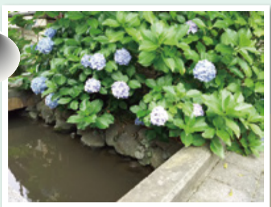
1 種類 アジサイ 場 上小岩親水緑道