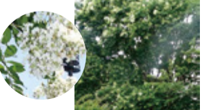
4 葛西臨海公園(日本庭園付近)