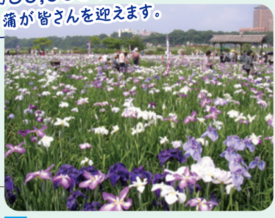
2 第36回 小岩菖蒲園まつり 6月3日(土)~18日(日)開催

期間中の土日 直通バス運行 JR小岩駅~小岩菖蒲園 ※6月3日(土)・4日(日) 足立区しょうぶ沼公園との無料シャトルバス運行