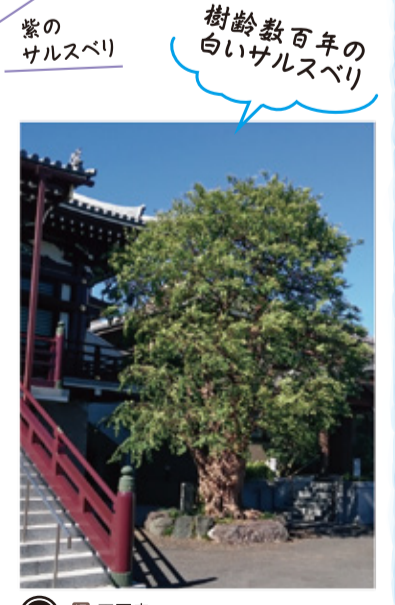
樹齢数百年の 白いサルスベリ