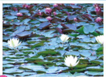
3 スイレン 場 行船公園 (平成庭園) 北葛西3-2-1