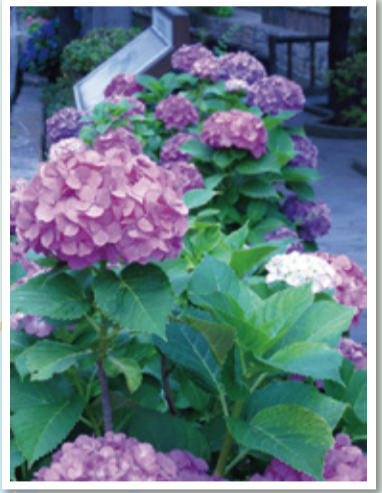
2 種類 アジサイ 場 古川親水公園