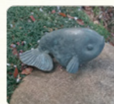
船堀グリーンロードで見つけた金魚のモニュメント

中国から16世紀頃日本へ伝来。当初は大名達が中心でしたが、日本でも金魚の養殖が始まり、庶民を中心に流行してきたようです。明治末期、都心の宅地化とともに金魚養殖者達は広い土地、良質な水を求め江戸川区に移り住むようになりました。第二次世界大戦後、一度養殖は衰退していましたが、養殖業者の努力により復活。江戸川区は日本でも有数の金魚生産地となりました。最盛期には養殖業者は23軒。生産は5,000万匹とも言われ、海外に輸出していました。