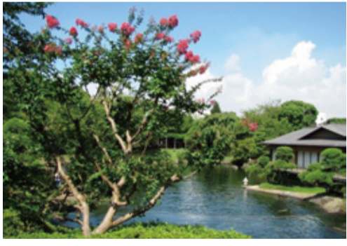
平成庭園は ピンクの サルスベリ

百日紅はピンクの花が百日間咲き続けることと、木肌がツルツルで猿も滑ることから名付けられました。